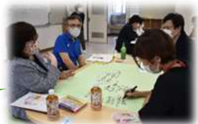
昨年度研修会の様子

今年度の“KAWANISHI”も、これまで同様に、教師同士が語り合い学び合う中で組織・個人共に力をつけていくことを目指します！