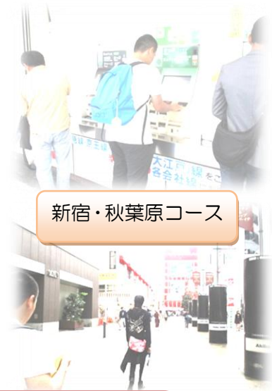
新宿・秋葉原コース

班別自主研修では、基本的に生徒たちのみで行動することを目標に活動しました。生徒達は駅構内では路線図などを見たり、歩きながら事前学習で準備した地図を見たりし、目的地にたどり着けるように頑張っていました