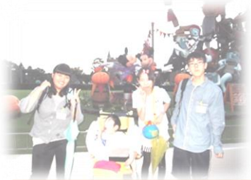
ディズニーランドコース